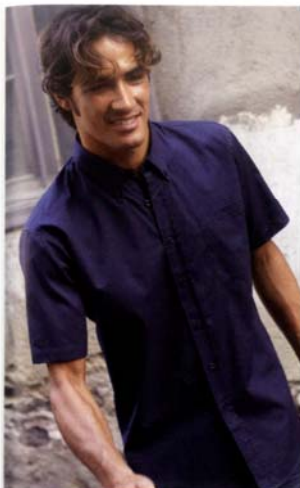
KS47 ARIANA II CHEMISE MANCHES COURTES 100% coton émeraude. Col boutonné. Boutons ton sur ton. 1 poche plaquée. 25 | 140 gr/m 2 S. M. L. XL. XXL. XXXL. XXXXL*. *XXXL uniquement en White, Navy