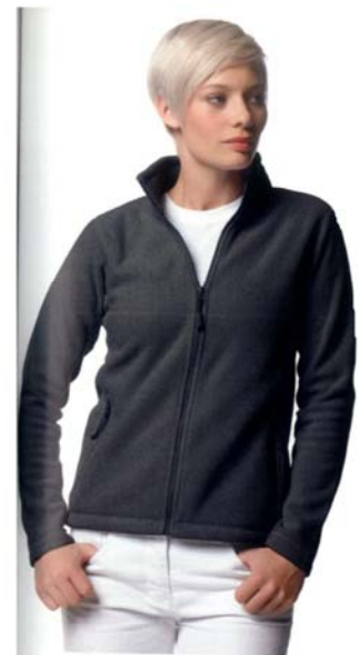
NEW RU8700F LADIES FULL ZIP FLEECE VESTE POLAIRE ZIPPÉE FEMME 100% polyester anti peluche. Matière molletonnée compacte pour plus de chaleur. Surface plus lisse pour faciliter la décoration. Coupe à pans.