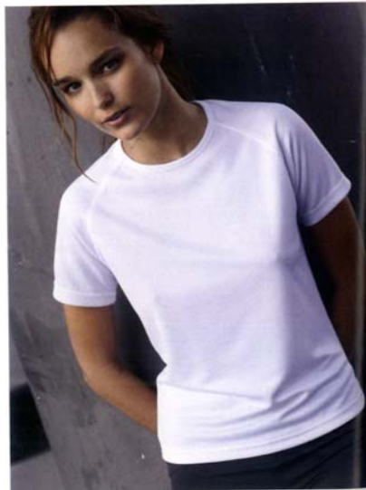
KS015 T-SHIRT FEMME 50% cool plus /50% polyester. T-Shirt femme respirant à séchage rapide. Manches raglan. 50 | 145 gr/m 2 S. M. L. XL.