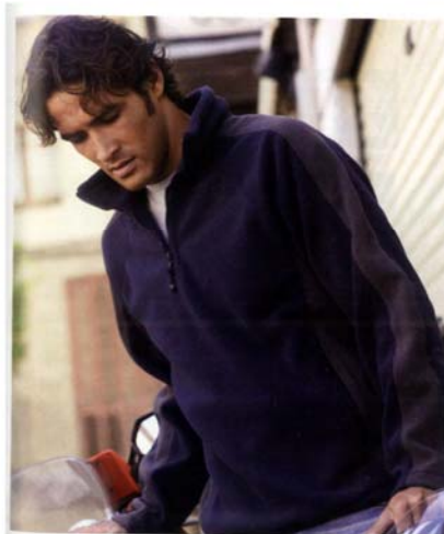
K914 SILVIO MICROPOLAIRE COL ZIPPÉ BICOLORE 100% polyester micropolaire. Col zippé, 2 poches zippées. Découpes dessus de manche et côtés contrastées. Cordon élastique avec stoppeur au bas du vêtement pour resserrage.